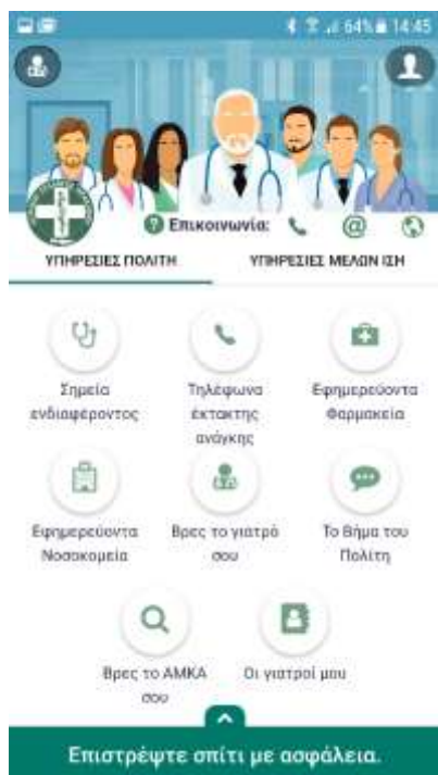
Εικόνα - 1