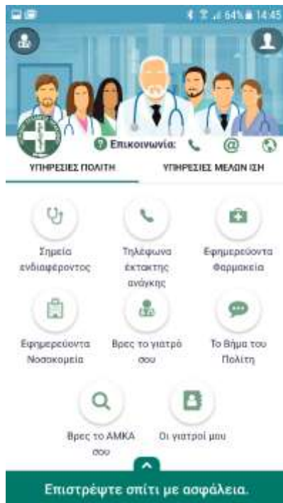
Εικόνα - 1